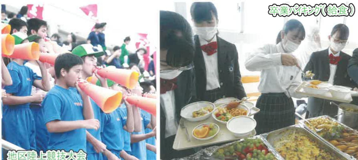
地区陸上競技大会