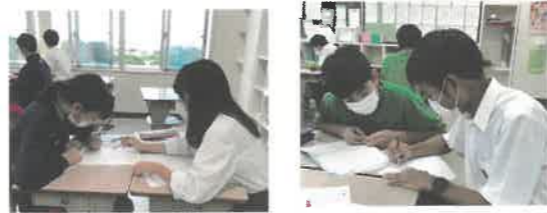
ピアチューターの様子

高校生が中学生のピアチューターとして学習を支援☆ 高校生にも中学生にも勉強になります♡