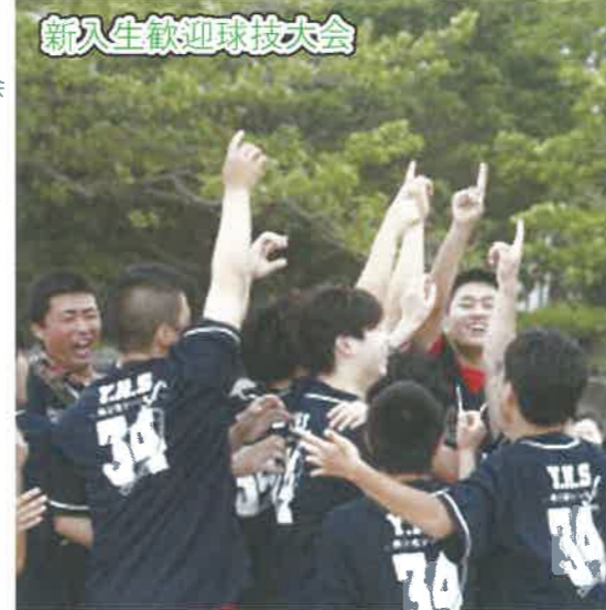
新入生歓迎球技大会