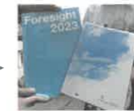
右:今未来手帳 (中2～高3)