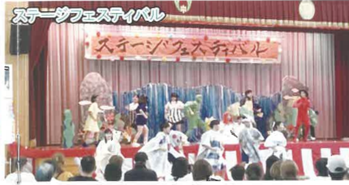
ステージフェスティバル